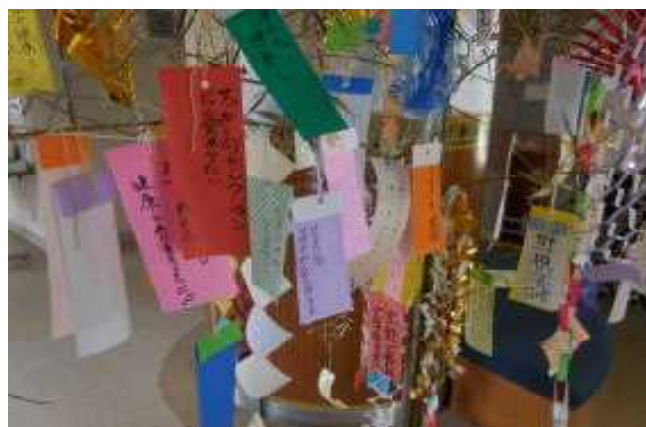
8月7日の短冊状況(室内)