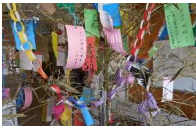
8月7日の短冊状況(玄関前)